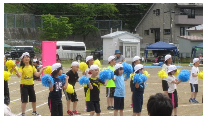
低学年「ドドドラえもん」