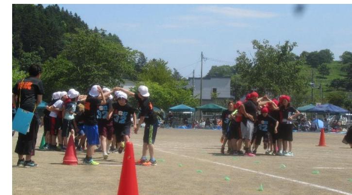
伝統の全校種目「トンネルゲーム」