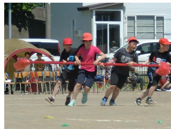
チームワークが重要。高学年の「厚岸台風」