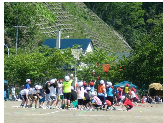
低学年の踊りも可愛かった「ダンシング玉入れ」