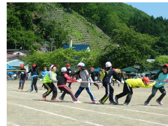
中学年の「綱取り合戦」 作戦も大切です。