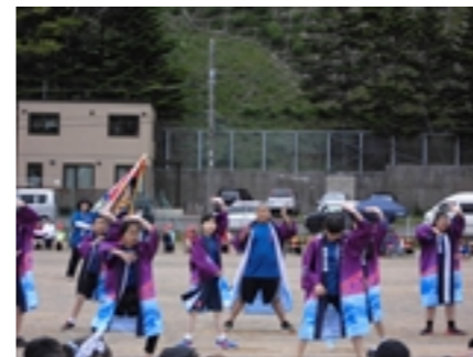
よさこいソーラン