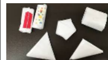
こんな感じでたたむと良いですね (たたみ方はネット等で検索！)

また、学校での配布物や返却された作品の持ち帰りなどで袋が必要になることもあります。そのような場合に備え、厚岸小学校では子ども達にビニール袋(レジ袋)を常に1～2枚持ってきてもらうこととしました。ある程度の大きさ(大きいレジ袋くらい)の袋をたたんでランドセルのポケットに1～2枚入れておいていただけますようお願いいたします。今後の活動の中で、子ども達が袋を持っていることを前提とした活動が出てくることをご理解願います。