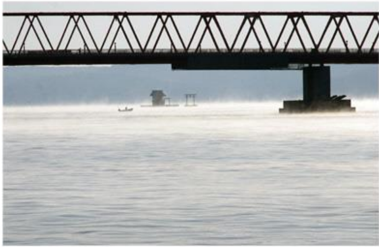
厚岸大はし かきじま