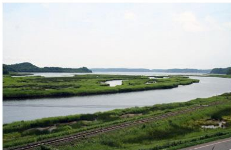
べかんべ牛しつげん