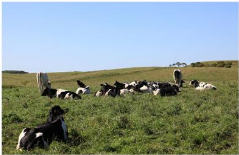
町えいぼくじょう