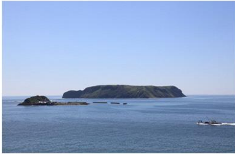
こじま 大こくじま