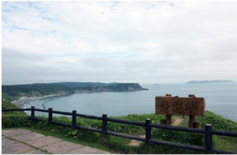
あいかっぷみさき