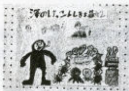
▲ 太田小学校児童作品