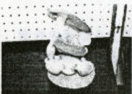
▲ 真龍小学校児童作品