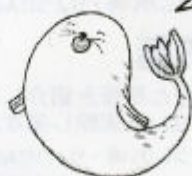
むつ むねみつ ＜陸奥 宗光＞