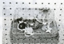
▲ 床潭小学校児童作品