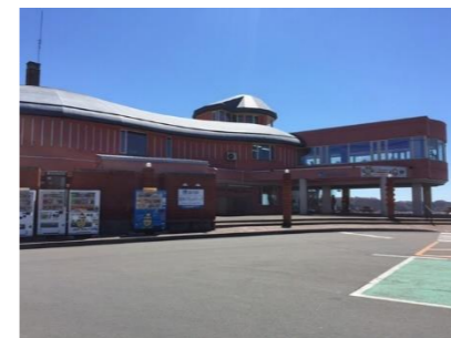
③厚岸味覚ターミナルコンキリエ