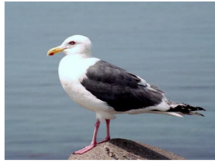
オオセグロカモメ