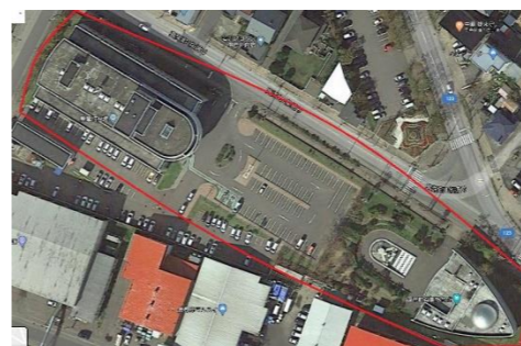
(厚岸町役場と海事記念館)