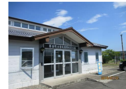
④太田屯田開拓記念館