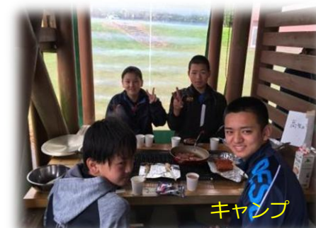
キ ャ ン プ