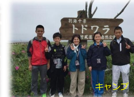
キ ャ ン プ