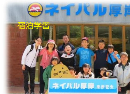
宿 泊 学 習