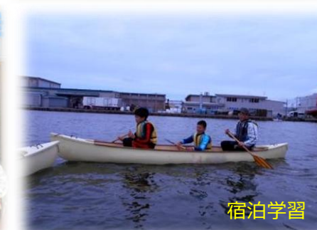
宿 泊 学 習