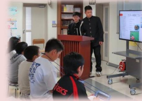
小学校の児童が発表を参観