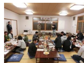
4月21日PTA・自治会合同歓迎会