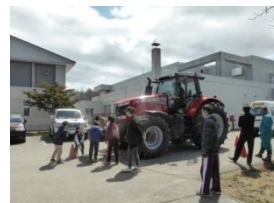
4月21日小学校交通安全教室