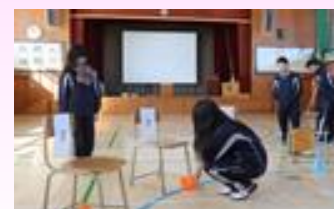
「逆椅子取りゲーム」の様子