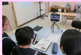
今回からリモート形式の会議

（昨年実施したレク）・逆椅子取りゲーム ・宝探し （今年のレクの内容）・だるまさんが転んだ ・カタカナナシ 今年は12月23日（火）に実施しました。