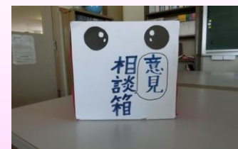
図書室の「意見相談箱」

みんなに相談を書いてもらい、生徒会がそれに答えます。意見を募集し、みんなの意見を踏まえていろいろな活動を行います。みんなの意見や、相談などに答えて、より良い学校になるように解決していきます。