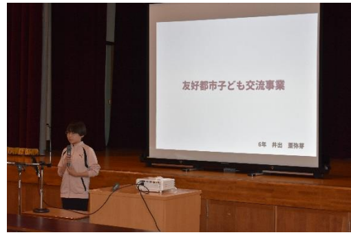
夏休み体験発表会がありました