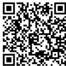
欠席連絡用QRコード

電話で欠席連絡をいただく場合は8:10以降に連絡いただけますようお願いいたします。