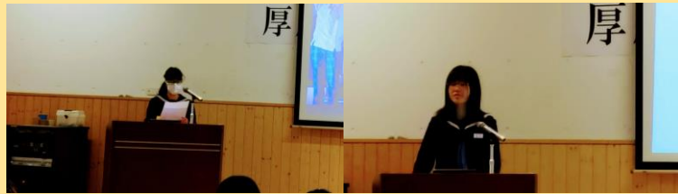
発表会に参加した本校の生徒たち

11月23日(木・祝)令和5年度厚岸町外国語発表会が真龍小学校の1階多目的ホールで行われました。中学生だけで行われていた英語暗唱大会にかわり、今年から新たに始まった取組です。小学校の5年生から中学校の3年生まで、町内6校から代表の児童生徒が集まって、自分たちが調べたことや身の回りの様子などを英語で発表しました。本校からは1年生の さんが「My Favorite Parson (私の好きな人)」、2年生の さんが「My Dream (夢紹介)」という内容で素晴らしい発表をおこなってくれました。