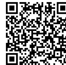
学校評価アンケートQRコード