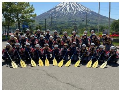
ラフティング体験